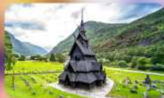
Unseen ไนท์ Borgund/Stave Church