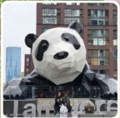
แพนด้าปิ่นตึก IFS