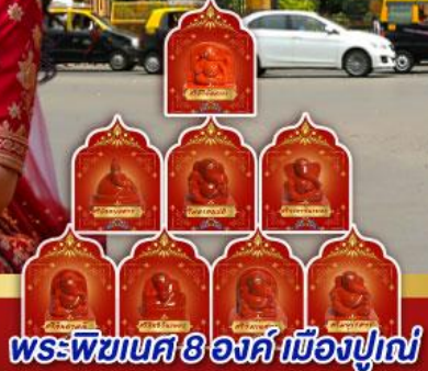
พระพิฆเนศ 8 องค์ เมืองปูणे