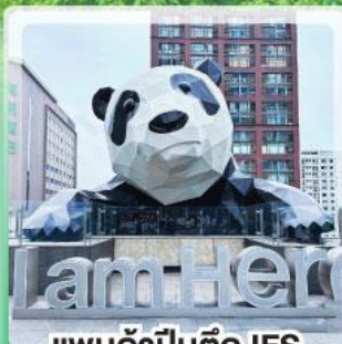
แพนด้าป็นตึก IFS