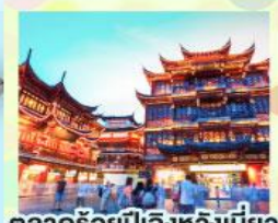
ตลาดร้อยปีเฉิงหวังเมี่ยว