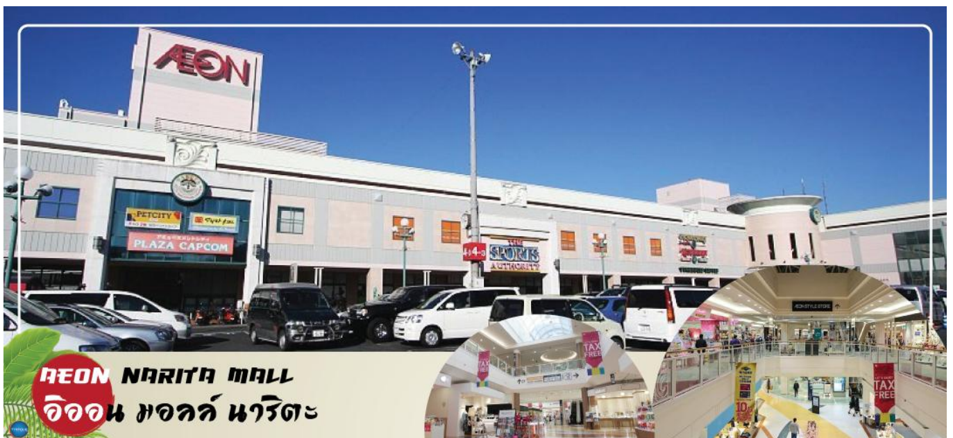
AEON NARITA MALL อโชน มอลล์ นาริตะ

จากนั้นเดินทางสู่ อโชน มอลล์ นาริตะ (Aeon Narita Mall) ห้างสรรพสินค้าที่นิยมในหมู่นักท่องเที่ยวชาวต่างชาติ เนื่องจากตั้งอยู่ใกล้กับสนามบินนานาชาตินาริตะ ภายในตกแต่งในรูปแบบที่ทันสมัยสไตล์ญี่ปุ่น มีร้านค้าที่หลากหลายมากกว่า 150 ร้านจำหน่ายสินค้าแฟชั่น อาหารสดใหม่ และอุปกรณ์ภายในบ้าน นอกจากนี้ยังมีร้านเสื้อผ้าแฟชั่นมากมาย เช่น MUJI, 100 yen shop, Sanrio store, Capcom games arcade และซูเปอร์มาร์เกตขนาดใหญ่