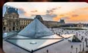
เข้าชมพิพิธภัณฑสถานลูฟวร์