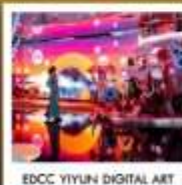
EDCC YIYUN DIGITAL ART