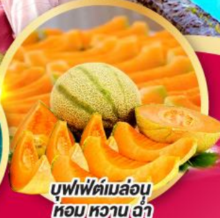
บุฟเฟ่ต์เมล่อน หอม หวาน ฉ่ำ