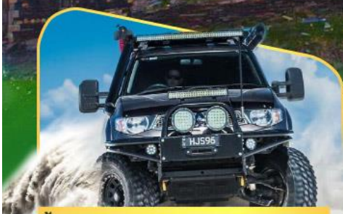
คันรถ 4WD สู่ใจกลางเทือกเขาคอเคซัส