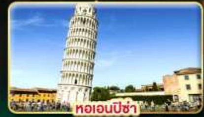
หออนพิซ่า