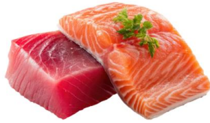
● ไก่ทานปลาดิบ