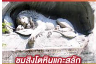
ชมสิงโตหินแกะสลัก