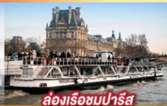
ล่องเรือชมปารีส