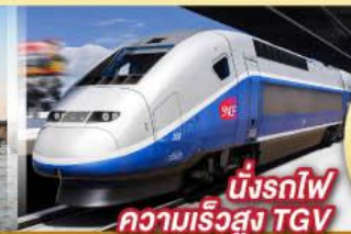
นั่งรถไฟ ความเร็วสูง TGV