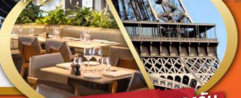
รับประทานอาหารกลางวัน บนหอคอไอเฟล

ไฮไลท์ในโปรแกรม • สะพานไม้ชาเปล ลูเซิร์น