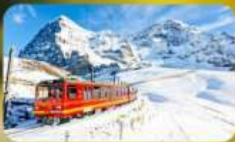
พิกัดยอดเขาจุงเฟรา

พักที่ Pullman Paris Tour Eiffel Hotel Rate !!! คือ: ดินแดนเก่า หรือ: ดินแดนเก่า