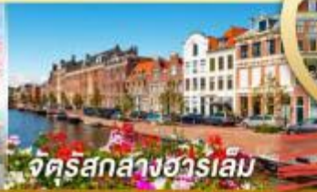
จัตุรัสกลางฮาร์เลม