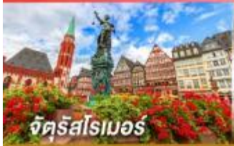
จัตุรัสโรเมอร์