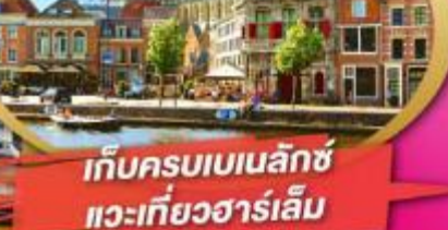
เก็บครบเบเนลักซ์ แวะเที่ยวฮาร์เลม