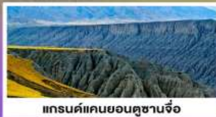
แกรนด์แคนยอนตูซานจื่อ