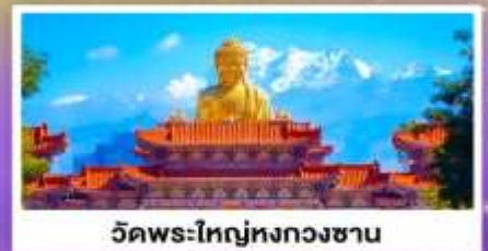
วัดพระใหญ่ทงกวงซาน