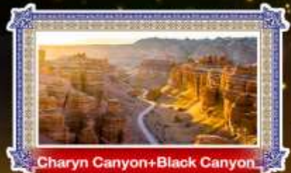
Charyn Canyon+Black Canyon