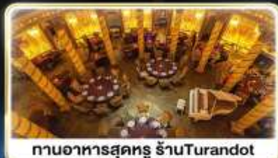
ทานอาหารสุดหรู ร้านTurandot