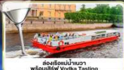
ล่องเรือแม่น้ำวอวา พร้อมเสิร์ฟ Vodka Tasting

เดินทาง : 14-21 มิ.ย.69 / 28 มิ.ย.-05 ก.ค.69 / 24-31 ก.ค.69