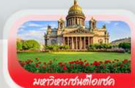
มหาวิหารเซนต์ไอแซค