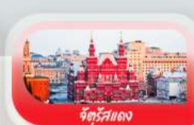
จัตุรัสแดง