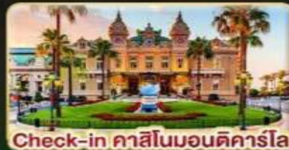
Check-in คาสิโนมอนติคาร์โล