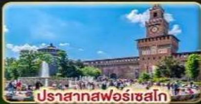
ปราสาทฟอรัสเซโก

เดินทาง : 28 พ.ค. - 06 มิ.ย. | 05-14 ส.ค. 15-24 ต.ค. 69