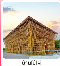
บ้านไม้ไผ่

ไอโวลท์ เทียวครบ สวนน้ำ Aquatopia & สวนสนุก Vin Wonder เวนิสแห่งเวียดนาม Grand World Phu Quoc แลนด์มาร์คสุดโรแมนติก