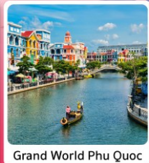
Grand World Phu Quoc