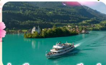
ล่องเรือทะเลสาบเบรียนซ์

พีชียอดเขาชุนเนกกา 1 ในเขาที่สวยงามที่สุดเมืองเซอร์แมท