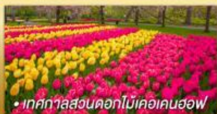
• เทศกาลสวนดอกไม้เคอเคนฮอฟ