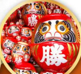
วัดคัตสึโองิ (วัดदारุมะ)

ชมความงามของกำแพงหิมะ เส้นทางสายอัลไพน์ ทากายามา (JAPAN ALPS SNOW WALL)