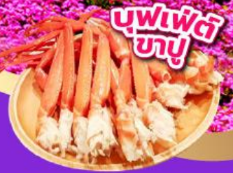
บุฟเฟ่ต์ ขาปู