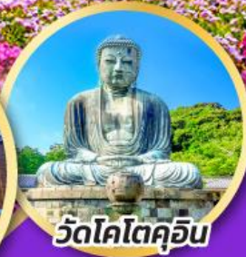
วัดโคโตคุอิน