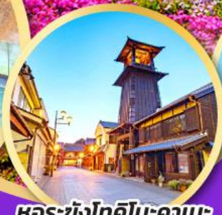
หอรบั้งโทคิโนะคาเนะ