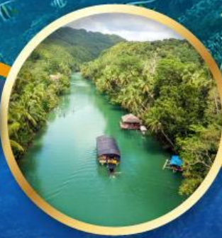
ล่องเรือแม่น้ำโลบ็อก