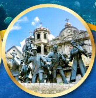
อนุสาวรีย์มรดกแห่งเซบู