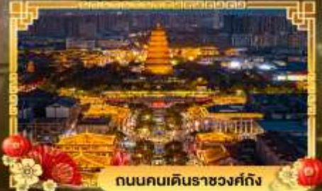
ถนนคนเดินราชวงศ์ถัง