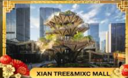
XIAN TREE&MIXC MALL