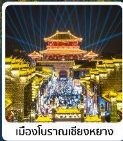
เมืองโบราณเซียงหยาง