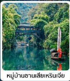
หมู่บ้านชาเมี่ยหมื่นเจีย