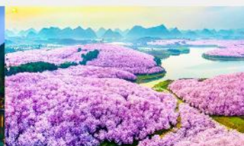
ชากรุง-ผิงป่า

*ทางบริษัทฯ ขอสงวนสิทธิ์ในการสลับโปรแกรมทัวร์ตามความเหมาะสมขึ้นอยู่กับสถานการณ์หน้างาน โดยคำนึงถึงผลประโยชน์ของลูกค้าเป็นสำคัญ