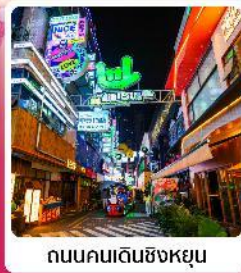
ถนนคนเดินซิงหยุน

• โฮเทล สวนชาคุระผิงปา หนึ่งในสถานที่ชมดอกชาคุระที่ใหญ่ที่สุดในโลก น้ำตกสวยระดับ 5A น้ำตกหวงกั๋วซู่ หมู่บ้านจีนโบราณ วูเจียงจ้าย