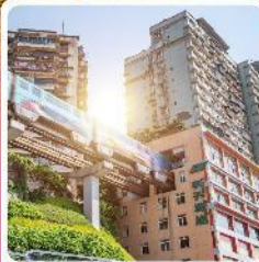
รถไฟทะเลลูติก