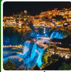
ฟูหลงจีน