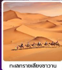
ทะเลทรายเสี่ยชวาน