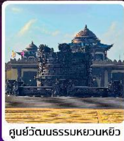
ศูนย์วัฒนธรรมหยวนเหยิว