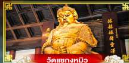
วัดเข่งทมิฬ