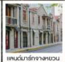
แลนด์มาร์กจางหยวน

เซี่ยงไฮ้ คคลาสสิก ไนท์ / 3 ดึกใหญ่แห่งเซี่ยงไฮ้ คองเรือหมู่บ้านโบราณจูเจียเจียว / EKA Tianwu / วัดหลงหัว แลนด์มาร์ก จางหยวน / ถนนหวยไห่ / ชมโชว์ ERA ที่โรงละครโด่งดังระดับโลก / ซินเทียนตี้