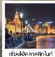
เซี่ยงไฮ้ คคลาสสิกไนท์