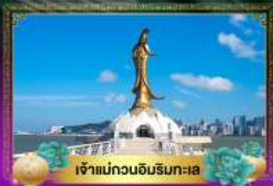
เจ้าแม่ทวนอิมริมทะเล