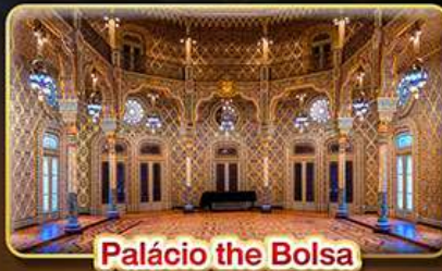
Palácio the Bolsa

สัมผัสดินแดนแห่งอารยธรรมมัวร์ “ชมเมืองมรดกโลก” สถาปัตยกรรมหลากหลายรูปแบบ