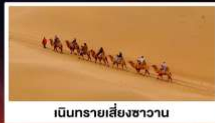
เนินทรายเสี่ยงชาวน