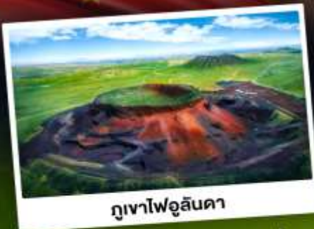
ภูเขาไฟอูลันดา

ท่องเที่ยวแดนแห่งทะเลทรายและทุ่งหญ้า ชมพระอาทิตย์ขึ้นทุ่งหญ้าออร์ดอส