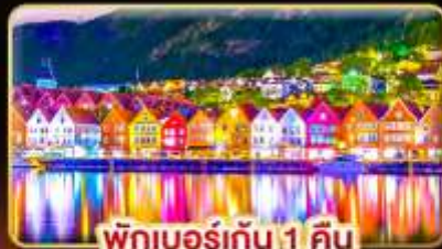
พักเบอร์เกน 1 คืน