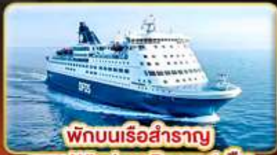
พักผ่อนเรือสำราญ แบบ Window Room 1 คืน

สัมผัสความเป็นที่สุดของ สแกนดิเนเวีย ให้ท่านได้พักผ่อนแบบ SLOW LIFE