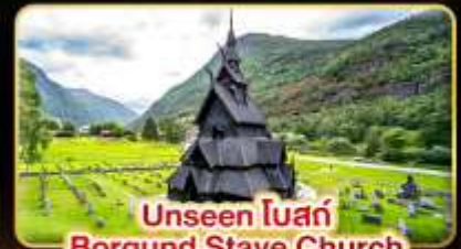
Unseen โบสถ์ Borgund Stave Church