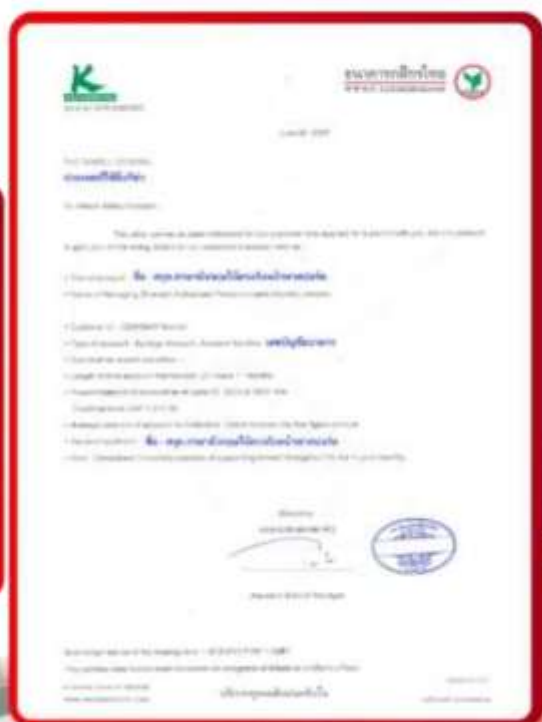
ตัวอย่าง Bank Guarantee ที่ยื่นได้ตั้งงกับธนาคาร