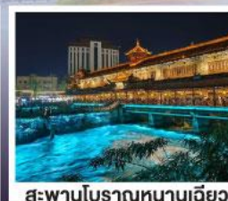
สะพานโบราณหนานเฉียว