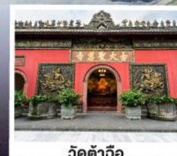
วัดคำฉื่อ