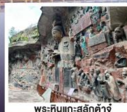
พระหินแกะสลักคำจู้