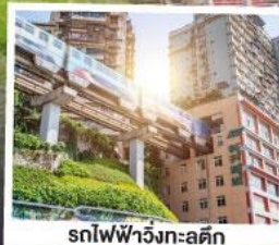
รถไฟฟ้าวงล้อลูกติก