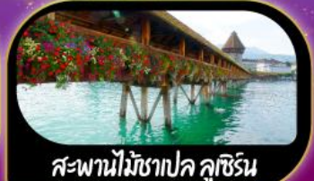
สะพานไม้ฆาปค ลูซิริน