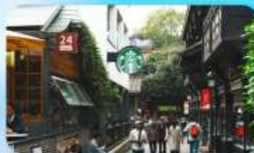
ถนนชอยกวางซวยแคบ