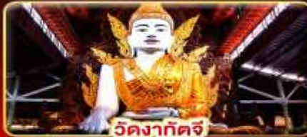
วัดงาทัดจี

สักการะ 3 มหาบุชาสถาน พักบนอินทร์แวน 1 คืน